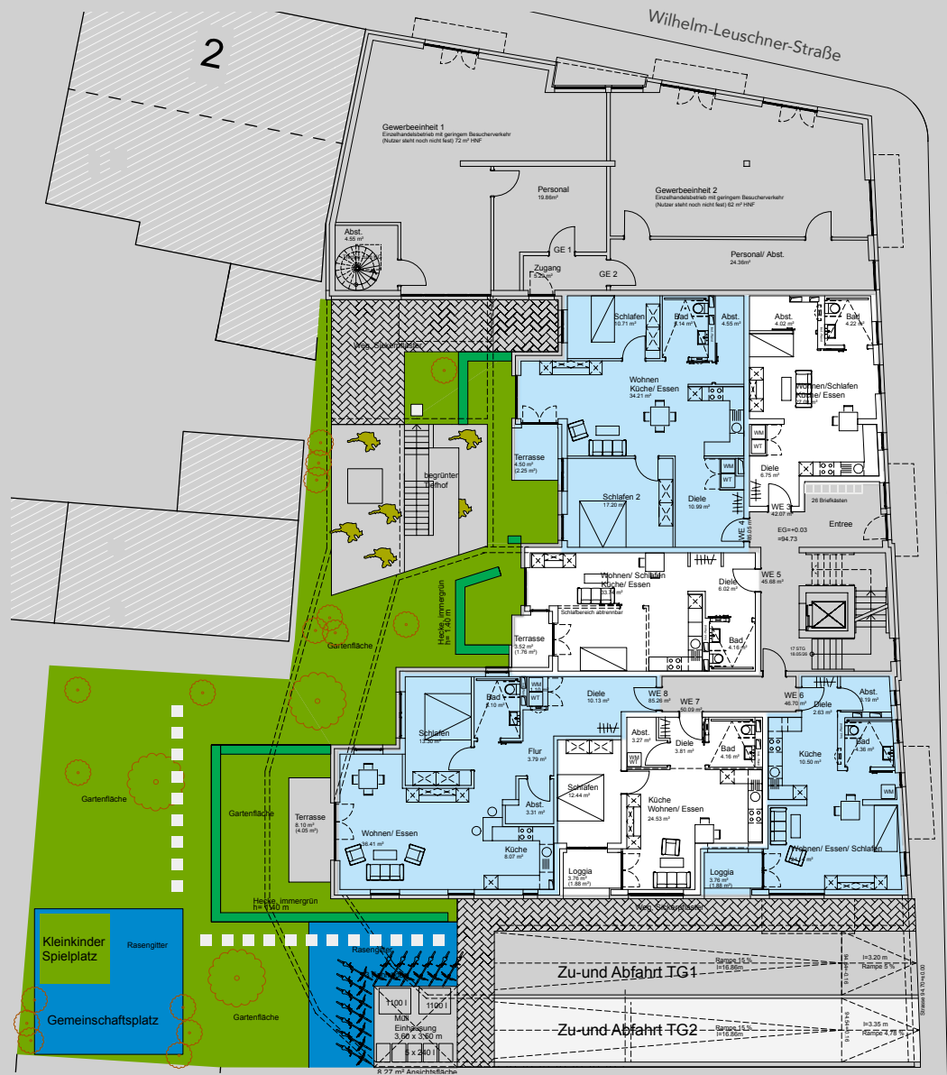
Wohnungsaufteilung Erdgeschoss mit Zu- und Abfahrt zur Tiefgarage und geschütztem Gartenbereich mit Gemeinschaftsplatz und Kleinkinder-Spielfeld