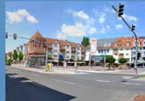
Markplatz (oben) und Wochenmarkt (unten) im Zentrum von Griesheim.

Die neuen Wohnungen liegen mitten im Herzen Griesheims, wenige Gehminuten zum Marktplatz, den angrenzenden Geschäften, zu Cafés und Kultureinrichtungen. Zwei Straßenbahnlinien in unmittelbarer Nähe verbinden Griesheim mit Darmstadt im Siebeneinhalb- bzw. Fünfzehn-Minutentakt. Ideal für Schüler, Studierende und Pendler bzw. zum Shopping, ins Theater, Konzert oder zum Beispiel zu einem Stadionbesuch beim Bundesligisten SV Darmstadt 98. Die zentrale Lage in der Mitte der Metropolregionen Rhein-Main-Neckar – zwischen Frankfurt, Mainz, Wiesbaden sowie Mannheim und Heidelberg ist der ideale Ausgangspunkt für viele Unternehmungen.