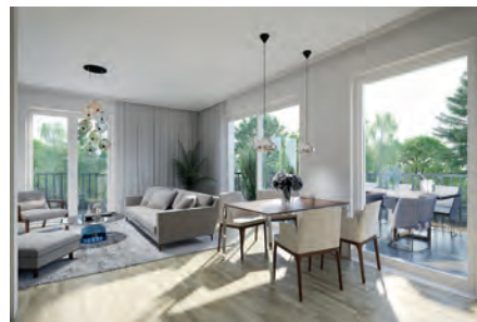
2-Zimmer-Wohnung: Beispielhafte Darstellung eines Wohnbereichs mit großem Balkon (12,5 qm)

Die Wohnungen sind modern ausgestattet und repräsentativ geschnitten. Offene Küche, Essbereich, Wohnzimmer mit großen Fensterflächen, ein zentral angeordnetes Badezimmer – alle Räume mit Tageslicht. Interessante Architektur und eine effektive Wärmedämmung, welche die Unterhaltskosten in Grenzen halten, Aufzüge zu jedem Stockwerk und die Vorbereitung für Smart Home Systems unterstreichen den hohen Anspruch dieser Häuser. Die lichtdurchfluteten Penthousewohnungen mit den großen Glasflächen und Terrassen bieten einen tollen Rundumblick und sind die Highlights der Solitärbauten.