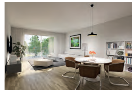
3-Zimmer-Wohnung: Beispielhafte Darstellung eines Wohn-Essbereichs mit großem Balkon (12,5 qm)