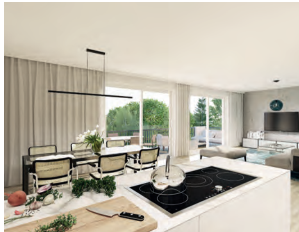
Penthouse-Wohnung: Beispielhafte Darstellung eines Wohn-Esszimmers mit Kochinsel und großer Dachterrasse