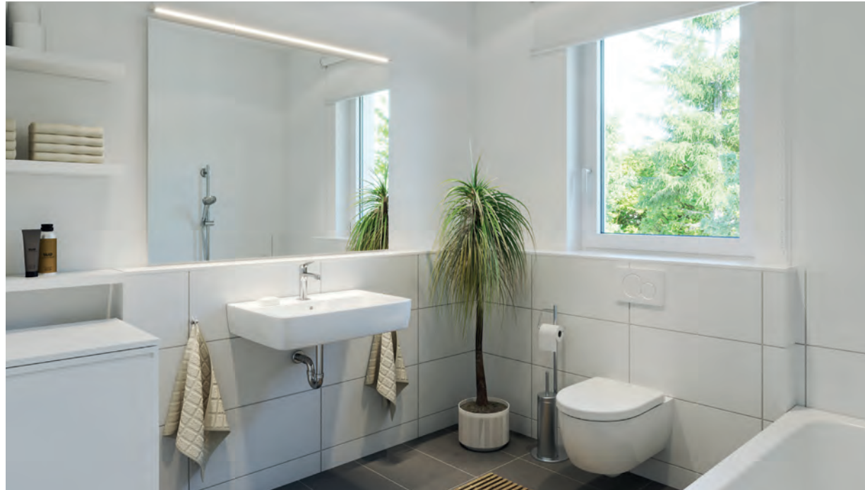
3-Zimmer-Wohnung: Beispielhafte Darstellung eines Tageslicht-Badezim- mers