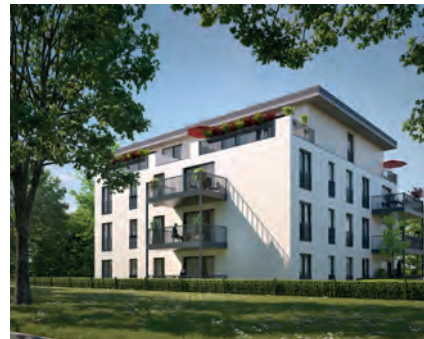
An den Endpunkten der grünen Achsen und mit unverbaubarer Sicht auf das Fauna-Flora-Habitat „Bulau“.

Lebensräume, die mit ihrer Ausstattung und innerhalb des ökologischen Gesamtkonzepts perfekt auf die Zukunft vorbereitet sind. Gut organisierte Grundrisse, Wohnungen, die sich mit ihren großen Terrassen nach außen öffnen und auf denen man die Sonne genießen kann. Große Fensterflächen, lichtdurchflutete Räume – Wohlfühl- und Komfortzone für die Familie, für ein Treffen mit Freunden, für ein entspanntes Leben – heute und morgen.