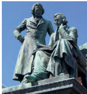
Brüder Grimm Denkmal

Shopping Mall, Wochenmarkt, Cafés und Restaurants, Kultur und Kunst, historische Kleinode, quirlige Straßen und Plätze – Hanau mit seiner großen Vergangenheit und einer positiven Zukunft. Eine Stadt, in der man sich wohlfühlen kann, die pulsiert und lebt, weltoffen und doch regional.