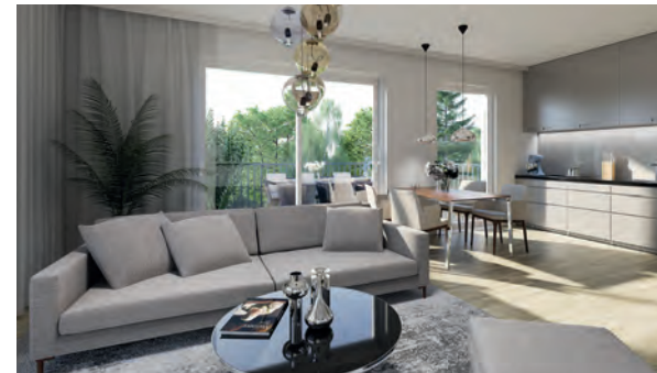
3-Zimmer-Wohnung: Beispielhafte Darstellung eines Wohnbereichs mit großem Balkon (12,5 qm)